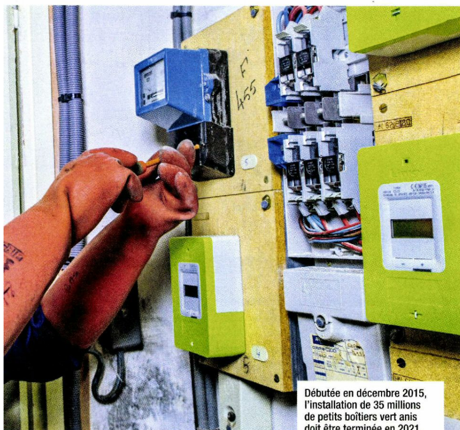
Débutée en décembre 2015, l'installation de 35 millions de petits boîtiers vert anis doit être terminée en 2021.

existants pour transporter des données. La fréquence pour Linky est à 75 kHz. Est-ce dangereux? L'association Robin des Toits soutient que oui. Elle explique que le réseau électrique a été conçu pour supporter un courant à 50 Hz, pas une fréquence à 75 kHz. Selon eux, l'ajout de la fréquence ferait « rayonner tout le réseau » en permanence.