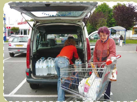
Portage de courses à domicile