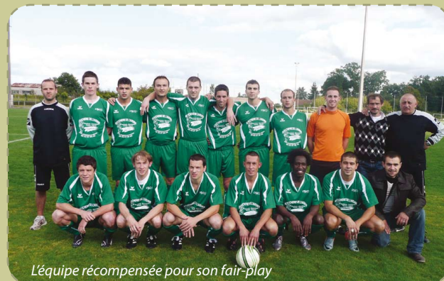
L'équipe récompensée pour son fair-play