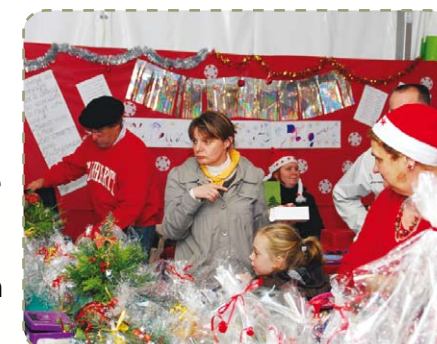
Rendez-vous les 4 et 5 décembre aux Izards

Parée des couleurs de Noël, l'esplanade des Izards accueillera les visiteurs autour des stands de productions artisanales des associations de la commune, le samedi 4 de 16h à 20h et le dimanche 5 de 10h à 17h. Meubles en bois, peintures, objets du monde, lampes... : c'est toujours l'occasion de dénicher de sympathiques cadeaux pour les fêtes ! L'ambiance musicale sera assurée avec des danses mahoraises, une chorale camerounaise, de la musique traditionnelle périgourdine ou encore un diseur d'orgue de Barbarie. De nombreuses autres animations sont au programme : des ateliers de « lettres au père Noël », de fabrication d'objets de Noël, de pyrogravure ou de réalisation de cartes de vœux. Un stand maquillage sera ouvert tout le week-end, tout comme celui des photos avec le père Noël. Le dimanche, la mère Noël fabriquera des sculptures de ballons pour les enfants.