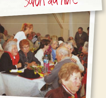
Gouter des aînés