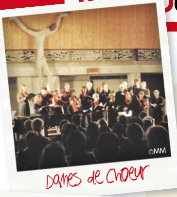
DAMES DE CHOEUR