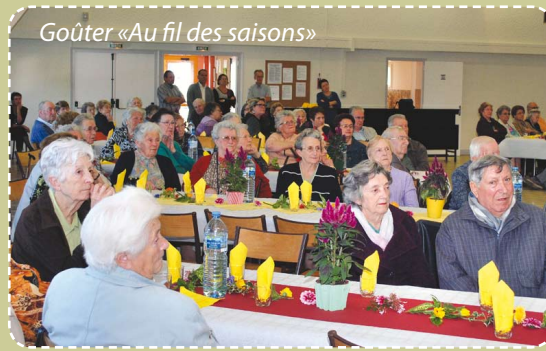
Goûter «Au fil des saisons»