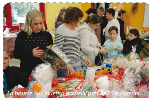
La bourse aux jouets a accueilli près de 250 visiteurs

Le collectif des associations de Pagot, avec le centre social St-Exupéry, s'active depuis trois mois pour organiser un « réveillon de la solidarité » le 24 décembre. De la fabrication d'objets pyrogravés pour le Marché de Noël à la collecte de jouets pour la Bourse du 6 novembre dernier, plus d'une trentaine de personnes est impliquée dans la préparation de la fête. Ce réveillon est ouvert à tous, pourvu que chacun s'inscrive dans la dynamique des préparatifs. Deux rendez-vous sont encore à venir : la décoration de la Pagode le 17/12 et un atelier de fabrication de chocolat et biscuits de Noël pour les enfants le 21/12. Ce réveillon est le 4 e organisé par le collectif : ce projet, né de la proposition d'une habitante de Pagot, s'enrichit chaque année ! C'est aussi sur une proposition de deux habitantes de l'espace Auriol que l'Amicale des Locataires HLM prépare le