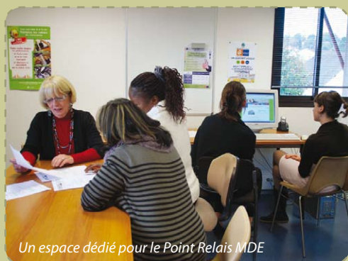
Un espace dédié pour le Point Relais MDE