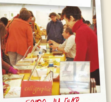
Salon du livre