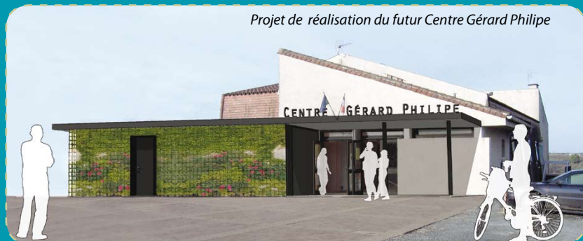
Projet de réalisation du futur Centre Gérard Philipe

La campagne de curage des 60 km de fossés se poursuit. Un chantier nécessaire pour assurer la bonne évacuation des eaux pluviales. La réalisation du tapis de l'av. des Églantiers a été retardée à cause des intempéries. Aux Pyramides, l'entrée de l'av. Roosevelt a été sécurisée par la mise en place d'une chicane ralentissant la vitesse des véhicules. À Castel Fadèze, le marquage au sol des places de stationnement sur les parties réhabilitées permettent de rendre définitivement les trottoirs aux piétons !