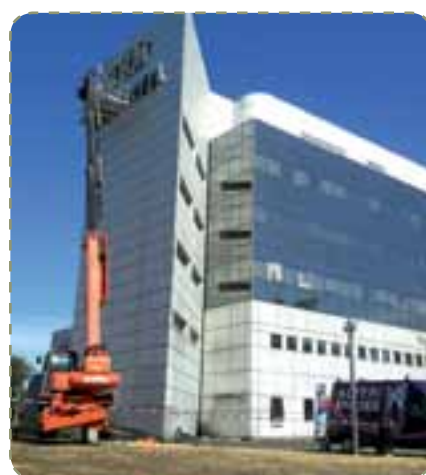
Ci-contre : une des réalisations de la société Alpéri pub Vergnaud (IBM en Gironde)

L'entreprise emploie à ce jour huit salariés. La conception de films protecteurs (contre les UV, la chaleur, les bris de glace) constitue une part croissante de l'activité.