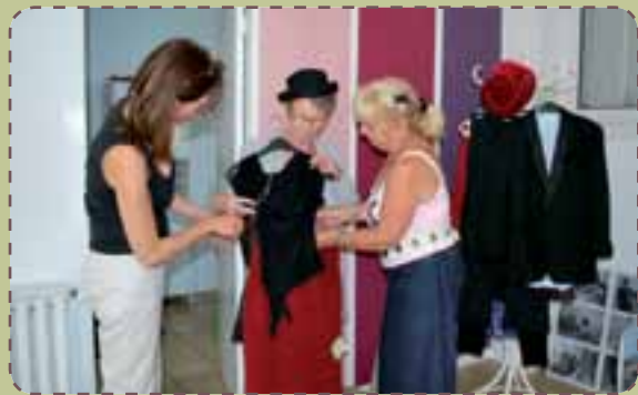
Les essayages se déroulent à l'Espace D'Marches.

Le 25 novembre prochain, le centre Gérard Philipe accueillera un défilé de mode intergénérationnel. Les tenues présentées seront vendues aux enchères, au profit du « Noël solidaire ».