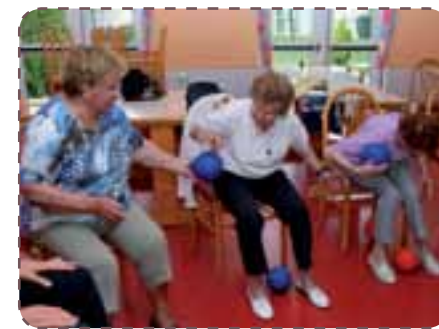
Ci-dessus : l'atelier gym sur chaise à la maison de retraite fait partie des actions qui ont contribué à l'attribution du label.

La municipalité va organiser une cérémonie pour officialiser l'obtention de ce label avec l'ensemble des partenaires locaux qui oeuvrent au service du « bien vivre » quotidien des aînés : le CCAS, l'ACADVS, le Conseil