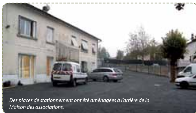
Des places de stationnement ont été aménagées à l'arrière de la Maison des associations.

L'entretien de la route de Campniac et de Bas-Bayot est programmé et sera réalisé en fonction des conditions météorologiques.