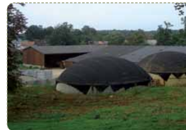
Le méthaniseur du lycée agricole sera similaire à celui du GAEC du Château d'Étrépiigny ci-dessus. Des aménagements paysagers seront réalisés aux abords.

Toutes les informations relatives à l'enquête publique sont disponibles sur le site internet de la préfecture : http://www.dordogne.pref.gouv.fr