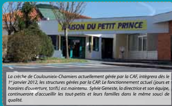
La crèche de Coulounieix-Chamiers actuellement gérée par la CAF, intégrera dès le 1 er janvier 2012, les structures gérées par la CAP. Le fonctionnement actuel (jours et horaires d'ouverture, tarifs) est maintenu. Sylvie Geneste, la directrice et son équipe, continueront d'accueillir les tout-petits et leurs familles dans le même souci de qualité.

À partir du 1 er janvier 2012, la compétence Petite Enfance sera gérée par la Communauté d'Agglomération Périgourdine. Un Point Accueil Petite Enfance est mis en place au service de tous les parents de l'agglomération pour la garde de leurs jeunes enfants.