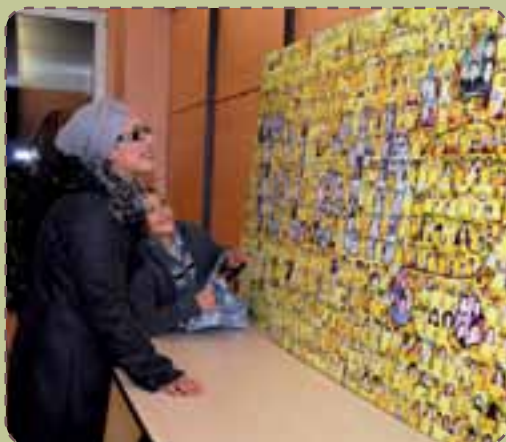
Ci-dessus : le défi réalisé en 2010

Du 2 au 4 décembre, Coulounieix-Chamiers s'Anime (CCA) donne rendez-vous aux Colomniérois pour participer au défi organisé avec de nombreux partenaires pour le Téléthon.