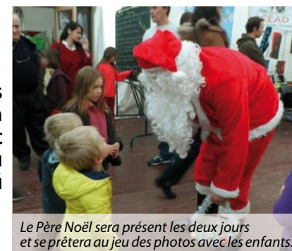
Le Père Noël sera présent les deux jours et se prêter au jeu des photos avec les enfants.

14 associations sont attendues les 3 et 4 décembre pour l'édition 2016 du marché de Noël ! Mêlant festivité et solidarité, les jeunes du Cocc foot participeront à un défi du Téléthon.