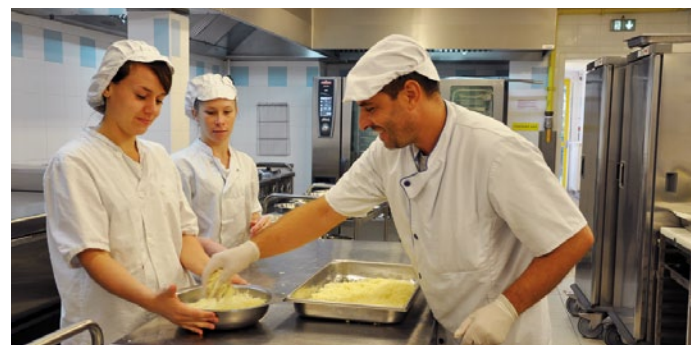
L'équipe de la restauration, en pleine préparation de crozets aux champignons gratinés, le plat d'un menu céréales.

Dans un contexte budgétaire délicat, continuer à privilégier le bio, le local et les produits de saison pour la préparation des repas est à la fois un choix politique et une équation difficile. Pour contribuer à la résoudre, les équipes de restauration municipale se forment et font évoluer leurs pratiques.