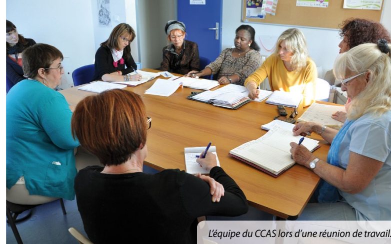
L'équipe du CCAS lors d'une réunion de travail.

► GYMNASÉ : La mairie, le Conseil départemental, le collège Jean-Moulin et la section Hand du Club omnisport de Coulounieix-Chamiers (Cocc) ont trouvé un accord concernant l'utilisation du gymnase Jean-Moulin. Afin de permettre aux pratiquants de poursuivre leur activité dans l'enceinte du gymnase scolaire, la commune s'est engagée pour la saison 2016-2017 à contribuer à hauteur de 6 000 € au paiement des fluides (eau, électricité, ...). En échange, la section pourra utiliser le gymnase 613 heures, notamment le soir. La mairie continue d'effectuer six heures de ménage par semaine et d'assurer le gardiennage des locaux utilisés, soit l'accueil, l'ouverture et la fermeture du site.