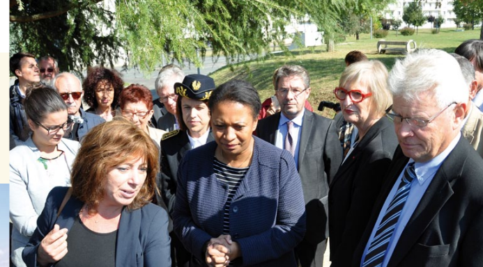
▲ Le projet a été présenté à Hélène Geoffroy, Secrétaire d'État chargée de la Ville (au centre) à l'occasion de sa venue en Dordogne le 6 octobre dernier.

La fin de l'année 2016 et le premier semestre 2017 seront consacrés à la finalisation des études et à l'écriture du projet. La convention qui entérinera les projets retenus doit être signée en juillet 2017. Ce n'est qu'à partir de 2018 que la mise en œuvre du projet pourra démarrer... Le temps est ici un outil majeur pour que "Chamiers cœur de ville 2025" soit un projet durable et pertinent.