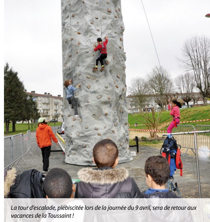
La tour d'escalade, plébiscitée lors de la journée du 9 avril, sera de retour aux vacances de la Toussaint !

Si vous avez des idées pour le bien de tous, merci de nous les adresser : conseil.sages.coulounieix@yahoo.fr. Nous les étudierons impartialement, sans aucun autre jugement que celui d'être agréable à la majorité des Colomniérois.