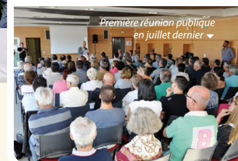
Première réunion publique en juillet dernier ▼