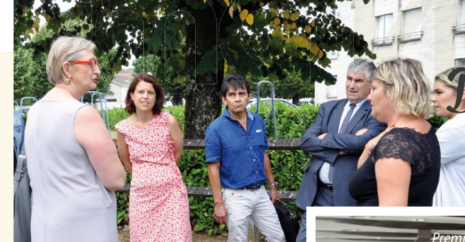
▲ Anne-Gaëlle Baudoin-Clerc, préfète de la Dordogne (2 e à gauche) a eu l'occasion d'échanger avec le Conseil citoyen lors de sa visite dans le quartier.