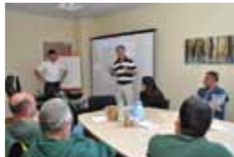
Lundi 2 avril 2012 : Formation à l'éco-conduite du personnel municipal