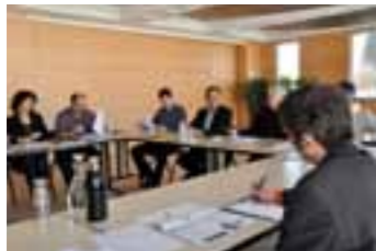
Réunion du Comité 21 du 5 mars 2012