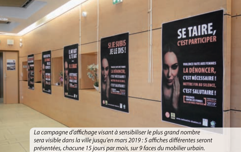
La campagne d'affichage visant à sensibiliser le plus grand nombre sera visible dans la ville jusqu'en mars 2019 : 5 affiches différentes seront présentées, chacune 15 jours par mois, sur 9 faces du mobilier urbain.