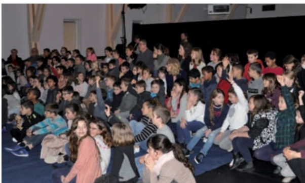
Les centaines d'écoliers des écoles Louis-Pergaud et Eugène-Le-Roy assisteront à un spectacle au centre Gérard-Philippe.

Ces animations qui inviteront petits et grands à voyager dans l'imaginaire des artistes sont organisées en partenariat avec la Ligue de l'Enseignement