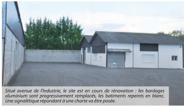
Situé avenue de l'Industrie, le site est en cours de rénovation : les bardages aluminium sont progressivement remplacés, les bâtiments repeints en blanc. Une signalétique répondant à une charte va être posée.

Participer à l'enquête : www.pays-isle-perigord.com facebook : dynacom.isle.en.perigord