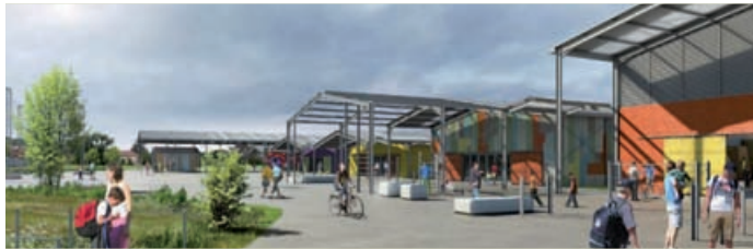
Le futur pôle d'économie sociale et solidaire et des cultures urbaines, présenté en réunion publique à la mairie le 26 novembre, sera un atout supplémentaire au service du dynamisme et de l'attractivité du territoire de l'agglomération.

Lancée en 2016, l'élaboration du PLUi a franchi une étape fondamentale : le Projet d'aménagement et de développements durables (PADD) a été débattu dans les 43 communes de l'agglomération puis présenté aux habitants lors de réunions publiques.