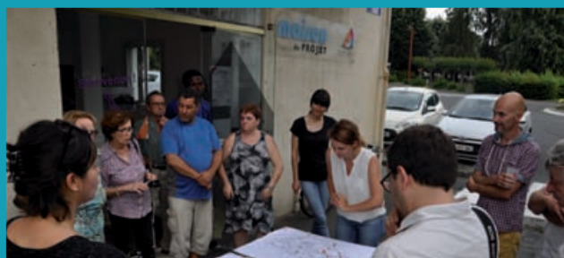
La Maison du Projet, inaugurée en mai 2017, est un lieu d'information permanent sur le renouvellement urbain. C'est aussi un lieu de débat et de partage d'idées : bienvenue au Café des Femmes et au Café des Citoyens !

Ces rendez-vous sont organisés dans le cadre de la mise en place de la Gestion urbaine et sociale de proximité (GUSP), en