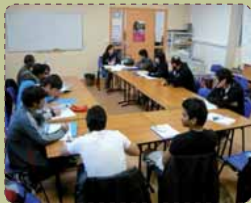
Âgés de 12 à 75 ans, les stagiaires représentent 38 nationalités.

Plus qu'un simple atelier de lutte contre l'illettrisme, l'atelier Plume, animé par le Centre social Saint-Exupéry, propose un parcours de formation qui prend en compte la globalité de la personne.