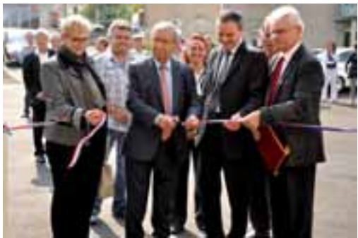
Inauguration de la cuisine centrale Eugène -Le-Roy

Une nouvelle année s'est écoulée sans que la fiscalité locale n'ait connu la moindre augmentation de la part communale. Les équilibres financiers ont été respectés , avec un niveau d'emprunt permettant à la fois une maîtrise de la dette et des investissements nécessaires à la modernisation du territoire. En matière de grands travaux, 2012 est notamment marquée par la réalisation d'équipements au service de tous : la réfection totale de la cuisine centrale (qui permet désormais de préparer dans les meilleures conditions les 750 repas quotidiens pour les écoles et le portage à domicile) et l' aménagement du giratoire du Dojo qui sécurise ce secteur en plein développement. De nombreuses réfections des chaussées et voiries ont aussi été au programme.