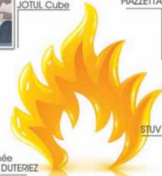
STUV 30 compact