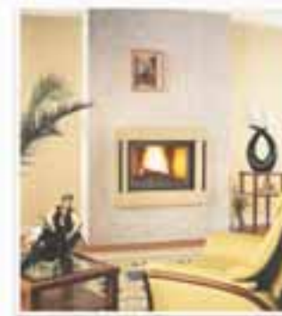
Cheminée SEGUIN DUTERIEZ