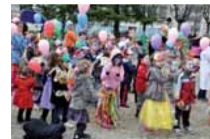
Les organisateurs espèrent encore plus de monde le 24 mars prochain.

Maison de l'enfance à Pagot... Le travail de préparation dure plusieurs mois et fédère le tissu associatif local autour de moyens et de compétences mutualisés. Et le résultat est à la hauteur : une parade toujours colorée et festive qui réunit les Colomniérois tous âges confondus.