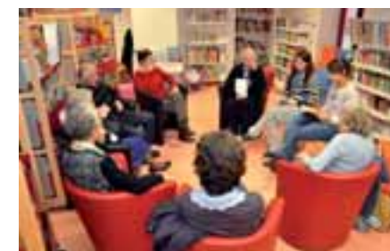
Calendrier des prochaines rencontres : 8 février, 22 mars, 26 avril, 17 mai et 7 juin.

La bibliothèque François Rabelais offre ainsi un nouvel accès à la culture et aux loisirs aux aînés, en même temps que des échanges intergénérationnels. Un beau complément au portage de livres, service gratuit à domicile proposé par l'équipe de la bibliothèque.