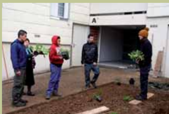
Les jeunes lycéens à l'ouvrage près du bâtiment A.

En septembre, une rencontre avec les élèves de terminale en bac professionnel "Aménagements paysagers", leurs deux enseignants et les habitants a été le point de départ