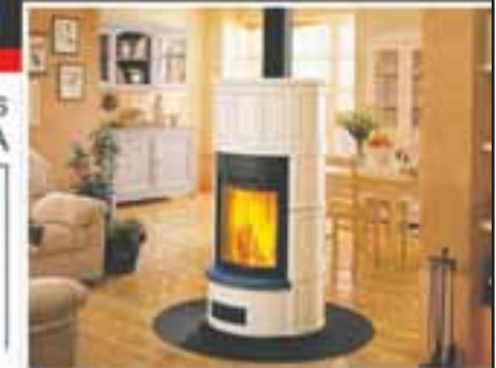
Poêle à granulés PIAZZETTA