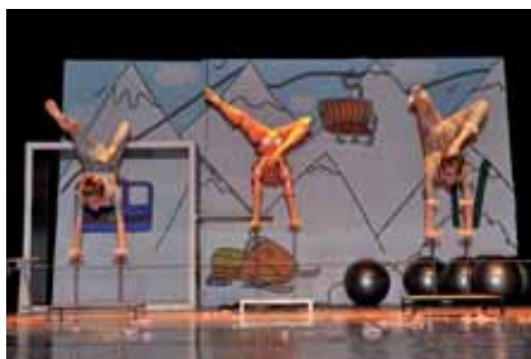
Un spectacle original clôture chaque fin d'année.

ou encore à Rosny-sous-Bois, Québec et Montréal. Il participe aussi régulièrement avec ses élèves aux animations de la commune, comme le Carnaval.