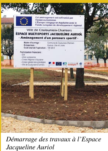
Démarrage des travaux à l'Espace Jacqueline Auriol

Des espaces intermédiaires sont aussi prévus avec des jeux pour enfants, une aire de ping-pong et deux points de rencontre pour les adolescents. Un local pour la pétanque sera mis en place à côté du boulodrome actuel.