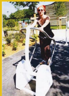
Exemple de station du parcours santé