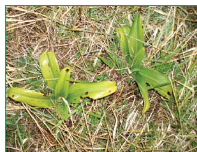
Rosettes d'orchidée avant floraison

La municipalité de Coulounieix-Chamiers et l'association Espaces, Vie, Nature organisent une Randonnée Orchidées Sauvages sur la commune. . Départ : devant la mairie annexe du bourg à 10h . Circuit : Bourg, Château de Plague, Château de la Rolphie, Fontaine du Voulon, Bayot, Paricot, route de Marival, Sarrazi, IME, Coulounieix . Distance : 12 km, possibilité 8 km en prenant un raccourci . Durée : 2h de marche le matin, 1h de visite et d'arrêt, 1h30 de repas et 1h30 de marche l'après-midi pour la digestion et le sport. Sieste en option... Donc arrivée vers 16h ! . Repas : vers la fontaine du Voulon. Chacun amène son repas et ses couverts (le vin et l'apéro sont les seuls produits dopant autorisés !) . Temps : ensoleillé mais bottes et Kway sont conseillés ! . Activités : marche, visite de Châteaux (si possible) et botanique (orchidées sauvages et autres plantes dans la limite de leur présence et des connaissances des spécialistes). Informations : Francis Cortez ☎ 06 86 49 89 43