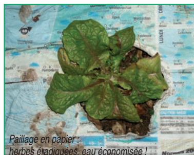
Paillage en papier : herbes étagées, eau économisée !