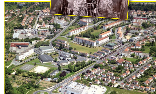
Vue aérienne de l'espace Jacqueline Auriol aujourd'hui... hier hippodrome de Chamiers !

Ce sont 23 numéros au total qui seront présentés par 800 hommes et 500 chevaux durant deux heures. Parmi eux, la reconstitution de la bataille de Little Big Horn qui vit l'anéantissement des 365 hommes du Général Custer par les Indiens de Sitting Bull. Je me livrerai à mes exercices de tir sur mon cheval au galop. Vous pourrez assister à une étonnante exhibition de cavaliers venus d'Europe, d'Asie, d'Afrique et d'Amérique, parmi lesquels des cosaques, des bédouins, des gauchos, des indiens ou la Cavalerie légère française. Le grand Wild West et Wild East seront réunis avec la diligence, le Poney Express et des scènes de vie dans les plaines de l'Ouest Américain. La troupe impériale Japonaise exécutera ses manoeuvres de guerre anciennes et modernes. Le prix des places va de 1,50 franc à 8 francs pour les loges. On peut se les procurer aujourd'hui au 4 place Bugeaud à la