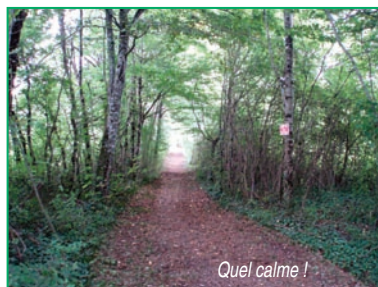
Quel calme !

La commune offrira aux Colomniérois choisis par la commission Développement Durable et Cadre de vie, des bons d'achats, des plants ou graines, des livres, des outils. La remise des prix s'inscrira dans la manifestation Eco-gestes organisée en juin.